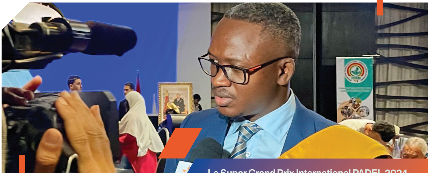
Le Super Grand Prix International PADEL 2024