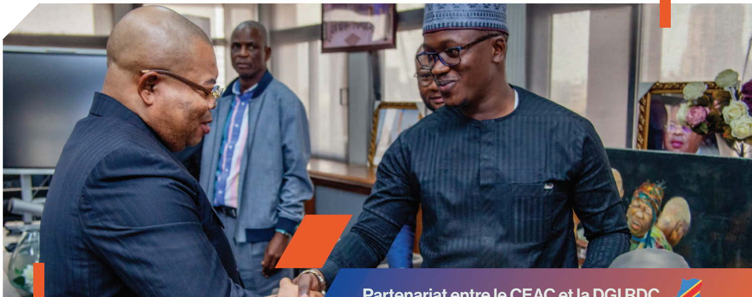
Partenariat entre le CEAC et la DGI RDC